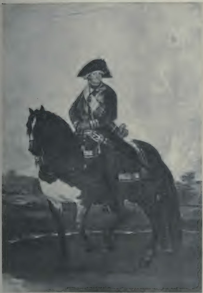
Portrait de Charles IV.

Par Francisco Goya (Musées du Prado, à Madrid.)